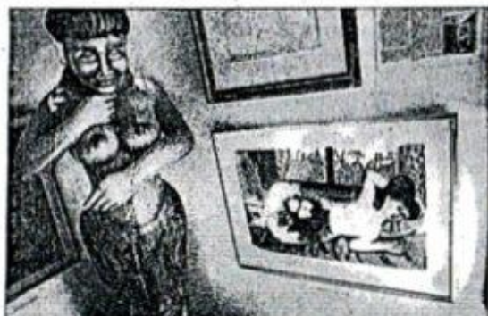
DAMER. Olle Olsson-Hagalunds liggande dam får hård konkurrens av en barkladd snidad dam som prytt ett okänt segelfartyg en gång i världen.